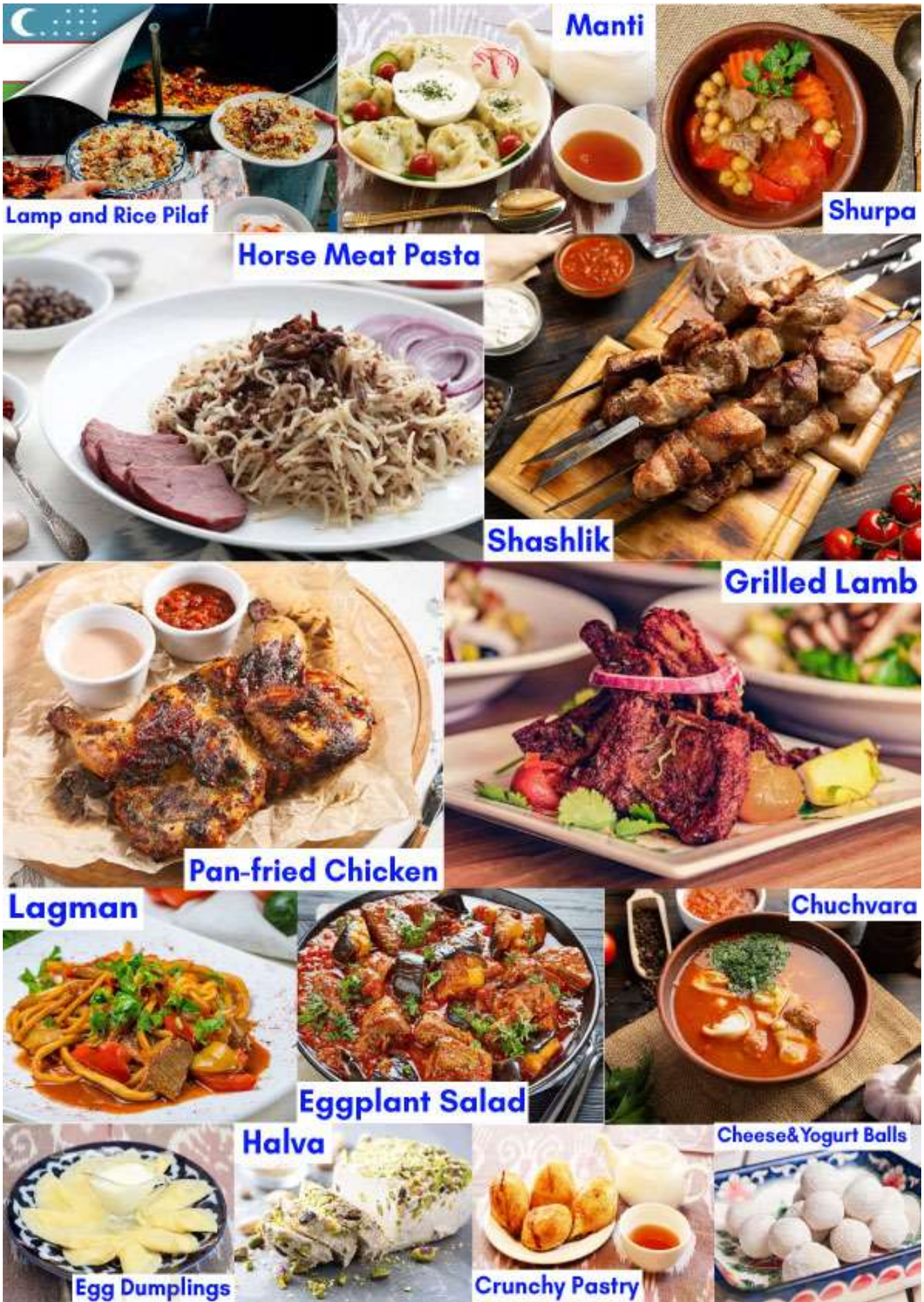
Lamp and Rice Pilaf