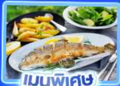
เมนูพิเศษ ปลาเกรดอย่าง

อัลสส์ตีทท์ เวียนนา อินส์บรุค ปราสาทนอยชวาสไตน์ ลูเซิร์น ริก