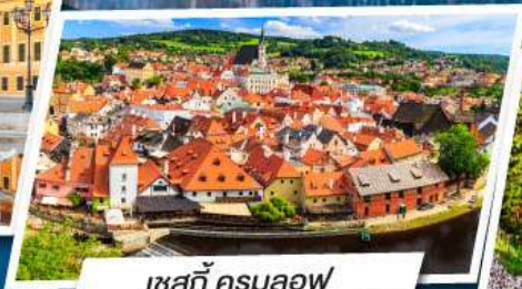
เชสกี ครุมลอฟ