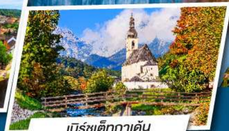
เบิร์ชเต็กกาเดิน