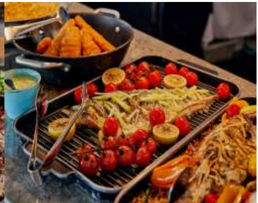
*** รูปเพื่อการโฆษณาเท่านั้น ***

นำท่านเดินทางเข้าสู่ที่พัก METRO MARLOW SYDNEY CENTRAL หรือเทียบเท่า (คืนที่7)