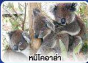
หมีโคอาล่า