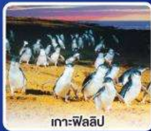
เกาะฟิลลิป

กึ่งลือบส์เตอร์ ท่านละ 1 ตัว พร้อมไวน์ชั้นเยี่ยม