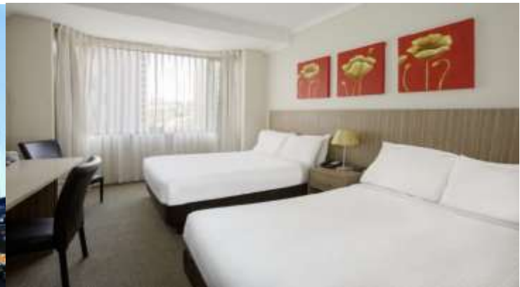
(โรงแรมย่านกลางเมือง ใกล้แหล่งช้อปปิ้ง เดินทางสะดวก) *รูปภาพเพื่อการโฆษณา*

วันที่สอง (วันที่ 28 ธ.ค.67) นครซิดนีย์ – อุทยานแห่งชาติบลูเมาท์เทนส์ – สวนสัตว์พื้นเมือง FEATHERDALE