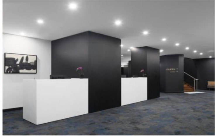
(โรงแรมย่านกลางเมือง ใกล้แหล่งช้อปปิ้ง เดินทางสะดวก) *รูปภาพเพื่อการโฆษณา*

วันที่ 30 (30 ธ.ค.67) เมลเบิร์น-รถไฟจักรไอน้ำโบราณ - ซิมไวน์ - ชมนกเพนกวินที่เกาะฟิลลิป