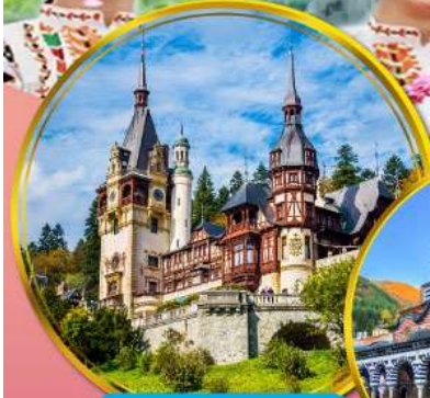
ปราสาทเปเลส