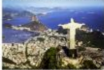
Rio De Janero

03.40 น. เดินทางถึงสนามบินเซาเปาโล ประเทศบราซิล