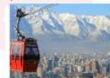
นั่งกระเช้าขึ้นสู่เนินเขาซานต้า ลูเซีย

xx.xx น. ออกเดินทางสู่เมืองปุนตาอาเรนัส เที่ยวบิน... xx.xx น. เดินทางถึงสนามบินปุนตาอาเรนัส ** พักที่ Novotel Las Condes Hotel 4* หรือเทียบเท่า **