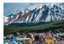
เมืองเอลคาลาฟาเต

** พักที่ Xelena Hotel 4* หรือเทียบเท่า **