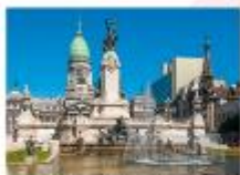
ชมเมืองบัวโนสไอเรส

23.55 น. ออกเดินทางสู่สนามบินอีสตันบูล เพื่อการบิน TK16