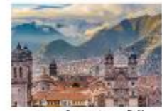
ย่านเมืองเก่าคุซโก้

** พักที่ San Agustin La Recoleta Hotel 4* หรือเทียบเท่า **