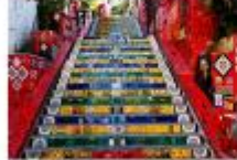
บันไดลาปา

** พักที่ Arena Copacabana Hotel 4* หรือเทียบเท่า **