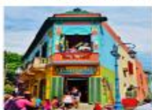
เมืองบัวโนสไอเรส

xx.xx น. ออกเดินทางสู่กรุงบัวโนสไอเรส เพื่อการบิน... xx.xx น. เดินทางถึงสนามบินบัวโนสไอเรส ประเทศอาร์เจนตินา