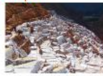
เหมืองเกลือโบราณ

** พักที่ San Agustin La Recoleta Hotel 4* หรือเทียบเท่า **