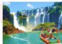
นั่งเรือเจ้ทมาตุตุ ชมความสวยงามน้ำตกอิกวาซู

** พักที่ Viale Cataratas Hotel 4* หรือเทียบเท่า **