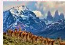
อุทยานแห่งชาติตอร์เรส เดล เพน

** พักที่ Altiplanico Hotel 4* หรือเทียบเท่า **