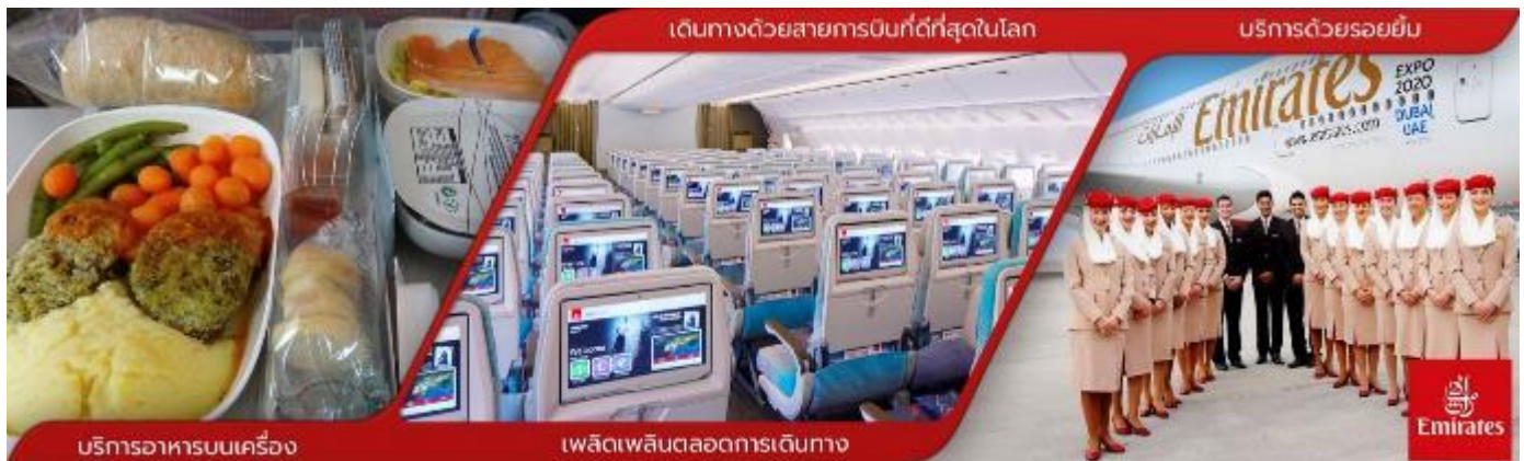
บริการอาหารบนเครื่อง

23.30 น. คณะพร้อมกันที่ สนามบินสุวรรณภูมิ ชั้น 4 บริเวณเคาน์เตอร์ T สายการบินเอมิเรตส์ EMIRATES AIRLINE (EK) โดยมีเจ้าหน้าที่ช่องทางบริษัทฯ คอยต้อนรับ และอำนวยความสะดวกด้านเอกสาร ออกบัตรที่นั่งและโหลดสัมภาระในการเดินทาง