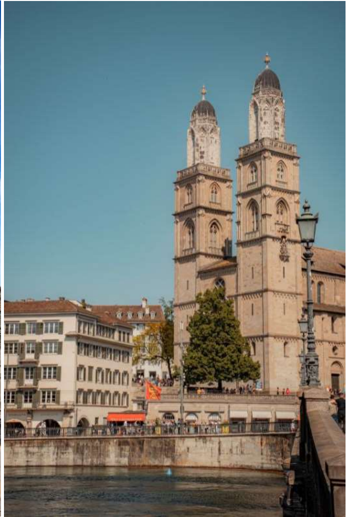
จุดชมวิวของเมืองซูริกที่ตั้งอยู่ในเมืองเก่า