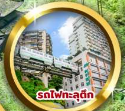
รถไฟทะเลตุ๊ก