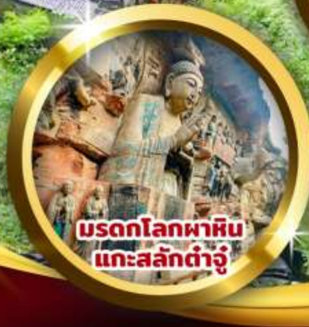
มรดกโลกผาหิน แกะสลักต้าจู้