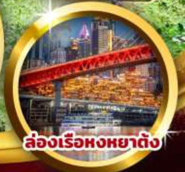
ล่องเรือหงหยาดำ