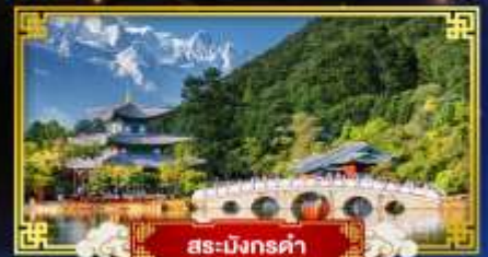
สะพานมังกรดำ