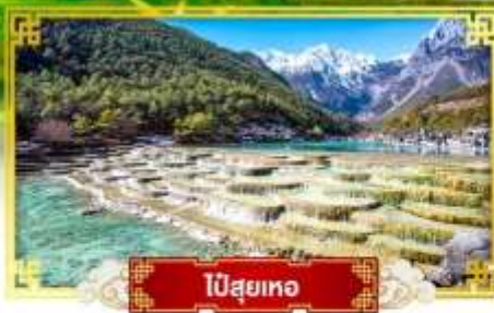
ไป๋สือเหอ