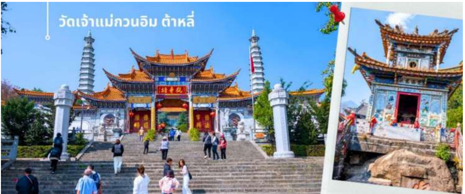
วัดเจ้าแม่กวนอิม ด้าหลี่

จากนั้นผ่านชม เจดีย์สามองค์ สัญลักษณ์ของเมืองต้าหลี่ ตั้งอยู่ภายใน วัดจงเซิ่ง (Chongsheng Temple) วัดเก่าแก่ที่สร้างขึ้นเมื่อศตวรรษที่ 9 นับว่าเป็นหนึ่งในเจดีย์ที่สูงที่สุดในประเทศจีน อีกทั้งยังมีความศักดิ์สิทธิ์เป็นอย่างมาก ว่ากันว่าเป็นหนึ่งในสิ่งก่อสร้างเพียงไม่กี่แห่งที่ไม่ถูกทำลายจากเหตุการณ์แผ่นดินไหวในเมืองต้าหลี่เมื่อปี ค.ศ. 1925 จึงกลายเป็นสถานที่เคารพศรัทธาของชาวต้าหลี่เป็นอย่างมาก