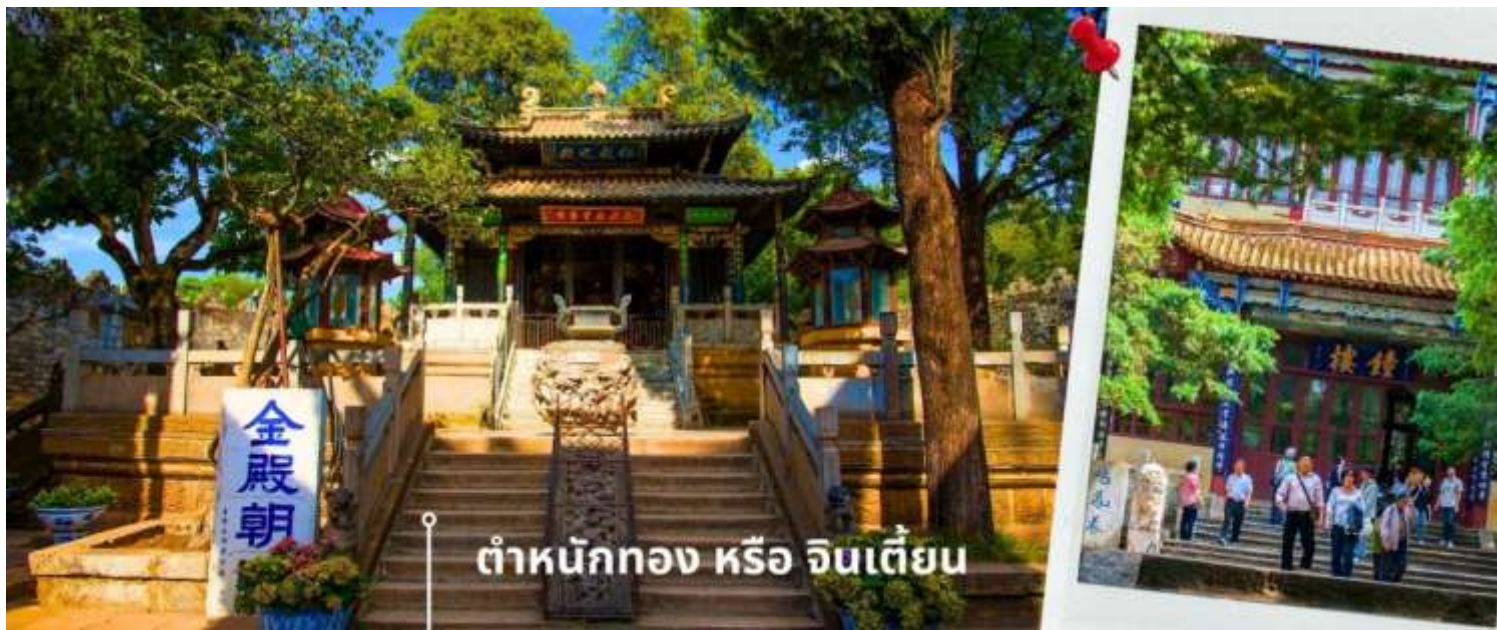
ตำหนักทอง หรือ จินเตี้ยน

ที่สุดของจีน ภายในมีรูปปั้นทองโดยมีเงินอยู่ (เสวียนอู่) เทพเจ้าลัทธิเต๋าเป็นองค์ประธาน นำท่านเดินทางสู่ สวนน้ำตกคุนหมิง เป็นสวนสาธารณะใจกลางเมืองคุนหมิง ถือเป็นสถานที่ท่องเที่ยวแห่งใหม่ และเป็นที่พักผ่อนหย่อนใจอดฮิตของชาวเมืองคุนหมิง ที่สร้างขึ้นด้วยฝีมือมนุษย์ น้ำตกแห่งนี้เป็นส่วนหนึ่งของ