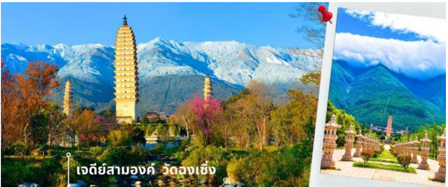
เจดีย์สามองค์ วัดจงเซิ่ง

จากนั้นผ่านชม เจดีย์สามองค์ สัญลักษณ์ของเมืองต้าหลี่ ตั้งอยู่ภายใน วัดจงเซิ่ง (Chongsheng Temple) วัดเก่าแก่ที่สร้างขึ้นเมื่อศตวรรษที่ 9 นับว่าเป็นหนึ่งในเจดีย์ที่สูงที่สุดในประเทศจีน อีกทั้งยังมีความศักดิ์สิทธิ์เป็นอย่างมาก ว่ากันว่าเป็นหนึ่งในสิ่งก่อสร้างเพียงไม่กี่แห่งที่ไม่ถูกทำลายจากเหตุการณ์แผ่นดินไหวในเมืองต้าหลี่เมื่อปี ค.ศ. 1925 จึงกลายเป็นสถานที่เคารพศรัทธาของชาวต้าหลี่เป็นอย่างมาก