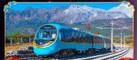
รถไฟภูเขาหิมะมังกรหยก