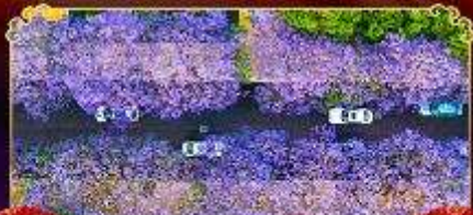
ดอกจาคาเรนด้า

"ทะเลดอกไม้สีม่วงบานสะพรั่งทั่วขุนนาง" นั่งรถไฟชมวิวสุดอลังการภูเขาหิมะมังกรหยก