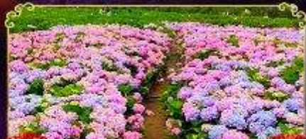
ดอกไฮเดรนเยีย