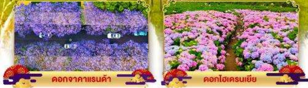
ดอกจากราเรนต์