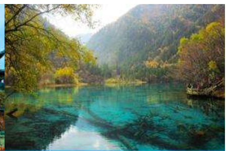
อุทยานจิวจ้ายโกว