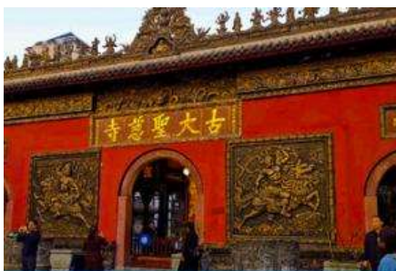
วัดต้าเจี๊ว

พักที่ MAOXIAN INTER HOTEL โรงแรมระดับ 4 ดาวหรือเทียบเท่าในเมืองมา่เจี้ยน