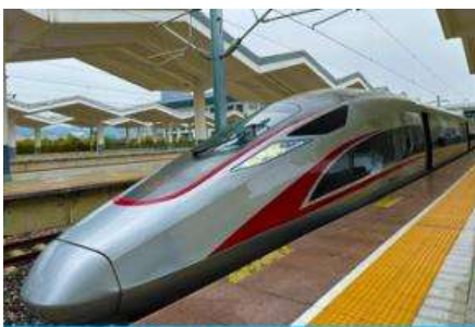
บริการรถไฟความเร็วสูง