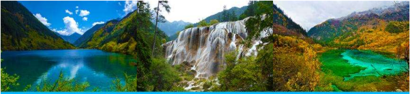
ทะเลสาบแรด (RHINO LAKE)