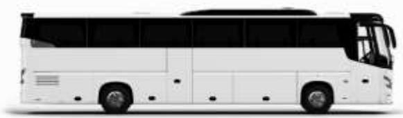
ตัวว่างรูปภาพ 1 ชิ้น

ค่าที่พักตามที่ระบุในรายการหรือเทียบเท่าระดับเดียวกัน (พักห้องละ 2 ท่าน) หากประเภทห้องที่ท่านริเสวนาเต็มออก เช่น ริเสวนาห้องพักเป็น TWIN BED หรือ DOUBLE BED ทางบริษัทขอสงวนสิทธิ์ในการปรับประเภทห้องพัก เป็นตามที่โรงแรมมีอยู่ โดยไม่ต้องแจ้งให้ทราบล่วงหน้า