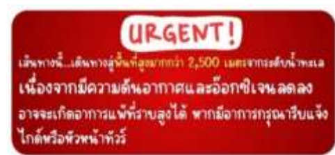
อุทยานสวรรค์ภูผาหิมะการ์เซีย ต่ากูปังชวน

เดินทางสู่ อุทยานน้ำแข็งต่ากู หรือ อุทยานสวรรค์ภูผาหิมะการ์เซีย ต่ากูปังชวน (รวมกระเช้าขึ้น-ลง) ต่ากูปังชวน Dagu Pingchuan ถือได้ว่าเป็นอุทยานสมบัติทางธรรมชาติที่ล้ำค่าของมณฑลเสฉวน ที่มีความงามไม่แพ้อุทยานและทะเลสาบไคโตบนโลกมนุษย์ จุดที่สูงที่สุดมีความสูงจากระดับน้ำทะเลประมาณ 5,286 เมตรเป็นภูเขาน้ำแข็งที่ศักดิ์สิทธิ์ ชาวบ้านเชื่อว่ามีเทพเจ้าพิทักษ์ภูเขานั่งอยู่ นั้งกระเช้าชมภูเขาน้ำแข็งหิมะ 3 ลูกที่เชื่อว่าเป็นสันหลังมังกรที่มีความงดงาม ฉากเบื้องหน้าเป็นภูเขาที่สูงชันตัดกับท้องฟ้าที่มีสีฟ้าคราม