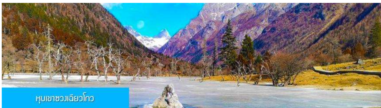
หุบเขาซวงเจียวโกว

นำท่านเที่ยวชม หุบเขาซวงเจียวโกว 双桥沟景区 ที่เป็นแหล่งท่องเที่ยวที่สวยงามที่สุดแห่งหนึ่งในเขตอุทยานภูเขาสี่ดรุณี นำท่านนั่งรถบัสของอุทยานที่วิ่งไปผ่านเส้นทางที่สร้างคู่ขนานกับลำธารภายในหุบเขา ท่านจะได้สัมผัสกับความสวยงามของทัศนียภาพธรรมชาติที่หาชมได้ยาก โดยมีภูเขาหิมะสูงตระหง่านอยู่เบื้องหลัง ธารน้ำใสไหลริน และสระน้ำที่มีสีเขียวมรกต ในฤดูใบไม้ผลิและฤดูร้อนท่านจะได้เห็นฝูงจามรีท่ามกลางทุ่งหญ้าเขียวขจี ส่วนในฤดูหนาวทุ่งหญ้าและพื้นดินจะปกคลุมด้วยพรมหิมะสีขาว.. รถบัสของอุทยาน