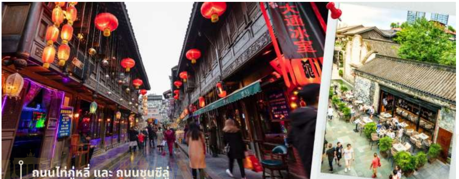
ถนนไท่กุ่หลี่ และ ถนนชุนซึลู่

ชมสะพานโบราณอันซุน-พร้อมชมแสงสียามค่ำคืน ตึกแฝดเทียนฟู เป็นสะพานข้ามคลองที่สร้างเป็นเหมือนอาคารอยู่ข้างบน ในช่วงเวลายามเย็นจะเป็นช่วงที่ผู้คนออกมาชมบรรยากาศบริเวณของสะพานแห่งนี้ และมีร้านค้ามากมาย รวมไปถึงบาร์เครื่องดื่มต่างๆ ที่ดึงดูดนักท่องเที่ยวได้เป็นอย่างดี เป็นสะพานที่ทอดข้ามแม่น้ำจินเจียง และเป็นรูปแบบสะพานมีหลังคา ตามลักษณะสถาปัตยกรรมจีนโบราณ อายุมากกว่า 300 ปี และในบริเวณใกล้เคียงกัน ยังเป็นที่ตั้งของ ตึกแฝด