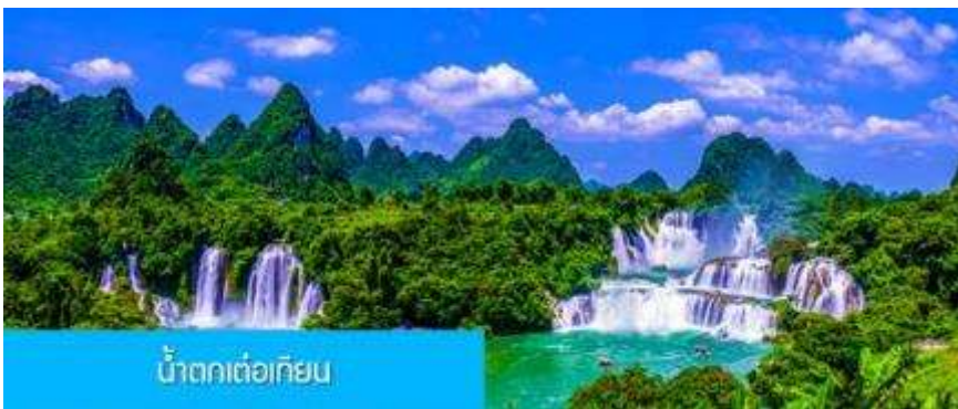
น้ำตกเต๋อเทียน

พักที่ VIENNA HOTEL ระดับ 4 ดาวท้องถิ่นหรือเทียบเท่าในเมืองฉงจั่ว