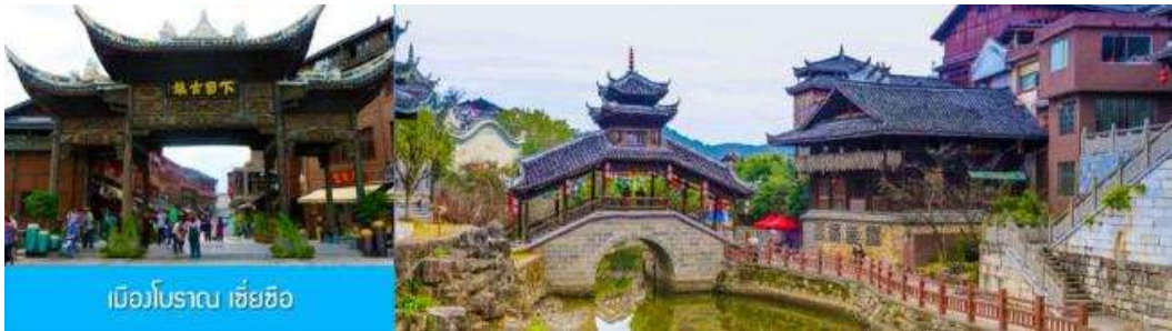
เมืองโบราณ เซี่ยซือ

พักที่ JIAN JIAN DUJIA HOTEL โรงแรมระดับ 4 ดาวท้องถิ่น หรือเทียบเท่าในหมู่บ้านม้ง