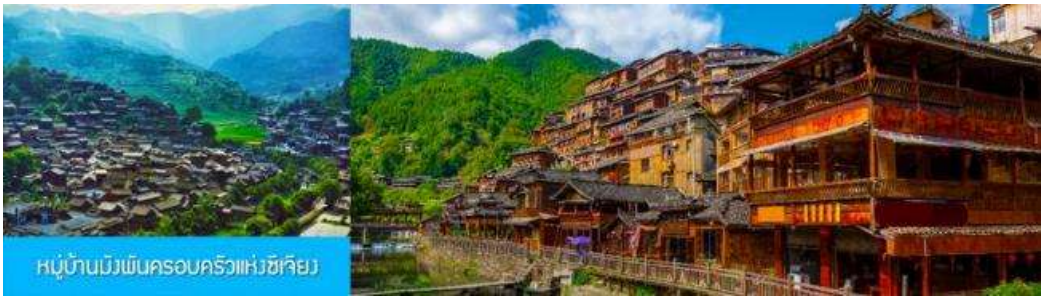
หมู่บ้านม้งพันครอบครัวแห่งซีเจียง