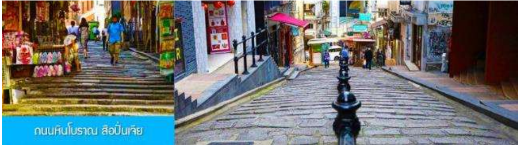
ถนนหินโบราณ สือปิ่นเจีย