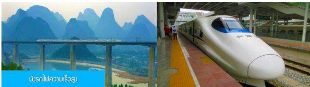
บริการรถไฟความเร็วสูง

พักที่ VIENNA HOTEL ระดับ 4 ดาวท้องถิ่นหรือเทียบเท่าในเมืองฉูหยุน