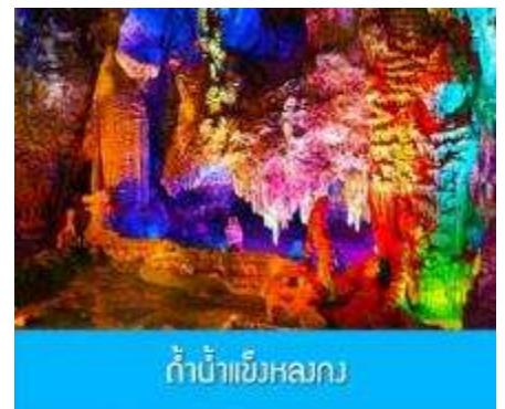
ถ้ำน้ำแข็งหลงก