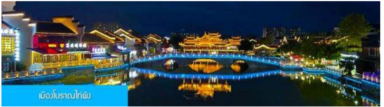
เมืองโบราณไท่ผิง