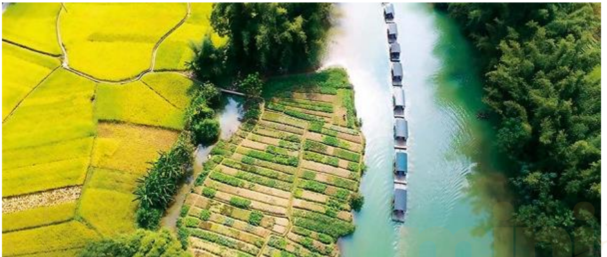
Bamboo rafts line up on the river in the Mingshi tourist resort.

รถบัสนำท่านไปส่งที่ท่าแพต้นน้ำ เพื่อให้ท่าน ล่องแพไม้ไผ่หมิงชื่อเถียนเหยียน ชมทัศนียภาพสองฝั่งลำน้ำ และบรรยากาศอันสดชื่นที่มีภูเขาที่เป็นฉากหลัง ที่เรียกว่า "วิวภาพเขียนร้อยสี" วิวนี้โด่งดังเพราะ มีซีรีส์ทีวี "ฮวาเซียนกุ" มาถ่ายทำที่นี่ ขณะล่องแพท่านจะได้พบเห็นวิถีชีวิตของชาวฉางชนบท ที่ออกมาทำกิจกรรมประจำวัน เมืองฉิงซีมีอากาศเย็นสบายและมีทัศนียภาพทางธรรมชาติสวยงามคล้ายเมืองกุ้ยหลิน