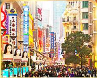
ถนนคนเดินหนานจิง