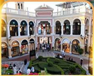
ช้อปปิ้ง Florentia Village Outlet