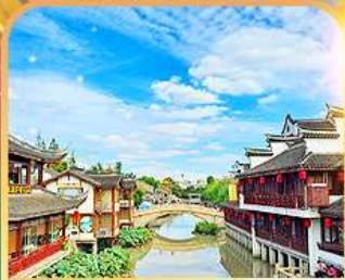
เมืองโบราณซีเป่า