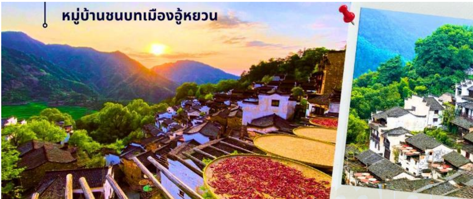
หมู่บ้านชนบทเมืองอู๋หยวน

นำท่านเดินทางสู่ หมู่บ้านชนบทเมืองอู๋หยวน ใช้เวลาเดินทางประมาณ 1.30 ชั่วโมง “เมืองชนบท ที่งดงามที่สุดของประเทศจีน” เป็นเมืองที่ธรรมชาติกลมกลืนกับวิถีชาวบ้านที่เป็นอยู่อย่างเรียบง่ายได้อย่างลงตัว บ้านเก่าแก่ที่อนุรักษ์ไว้อย่างดี สีสันความงามจากธรรมชาติหมุนเวียนไปตามฤดูกาล ทำให้นักท่องเที่ยวได้สัมผัสบรรยากาศที่แตกต่างกันออกไป ตามแต่ฤดูที่มาเยือนเมืองอู๋หยวนแห่งนี้ ซึ่งชาวบ้านยังคงใช้ชีวิตอย่างเรียบง่าย ใช้ชีวิตสบายๆ ริมสายน้ำ ในพื้นที่สีเขียวที่โอบล้อมด้วยภูเขา ด้วยความห่างไกลเมือง และข้อจำกัดเรื่องการเดินทางเข้าถึงในสมัยก่อน ช่วยปกป้องให้อู๋หยวนยังคงรักษาธรรมชาติและวิถีชีวิตแบบดั้งเดิมไว้ได้ แม้ว่าปัจจุบันการเดินทางมาที่อู๋หยวนจะสะดวกสบายขึ้นมาก และการพัฒนายังเข้าถึงทุกหมู่บ้าน แต่โชคที่ผู้คนได้เรียนรู้แล้วว่า พวกเขาโหยหาและยังต้องการให้มีหมู่บ้านที่มีบรรยากาศแบบนี้อยู่ต่อไป ดังนั้น อู๋หยวนจึงยังคงความบริสุทธิ์อยู่ได้ ภายใต้กระแสการพัฒนาสมัยใหม่ของจีน