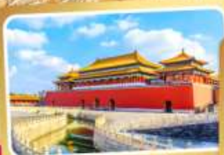
พระราชวังโบราณปักกิ่ง