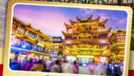
ตลาดร้อยปีเจียงหวงเมี่ยว