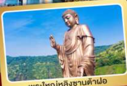
พระใหญ่หลังเขาต้าฝอ