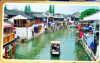
เมืองโบราณจู่เจียเจี้ยว