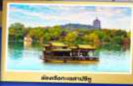
นั่งเรือชมทะเลสาบปิ๋ว