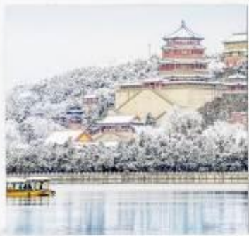
พระราชวังฤดูร้อน อวิเหอหยวน