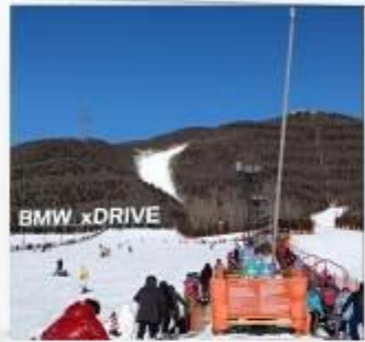
เล่นสกีจวิตุซ่าน