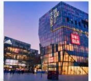
ชานหลี่ถุน