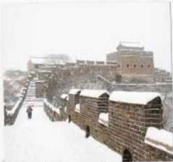
กำแพงเมืองจีน ด่านจวิหยงกวน