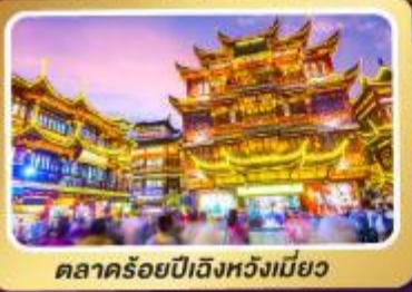
ตลาดร้อยปีเจิ้งหังเหมียว