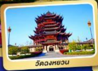
วัดจงหยวน