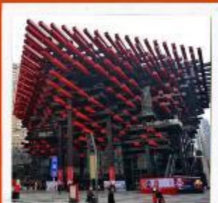
พิพิธภัณฑ์ศิลปะฉงชิ่ง