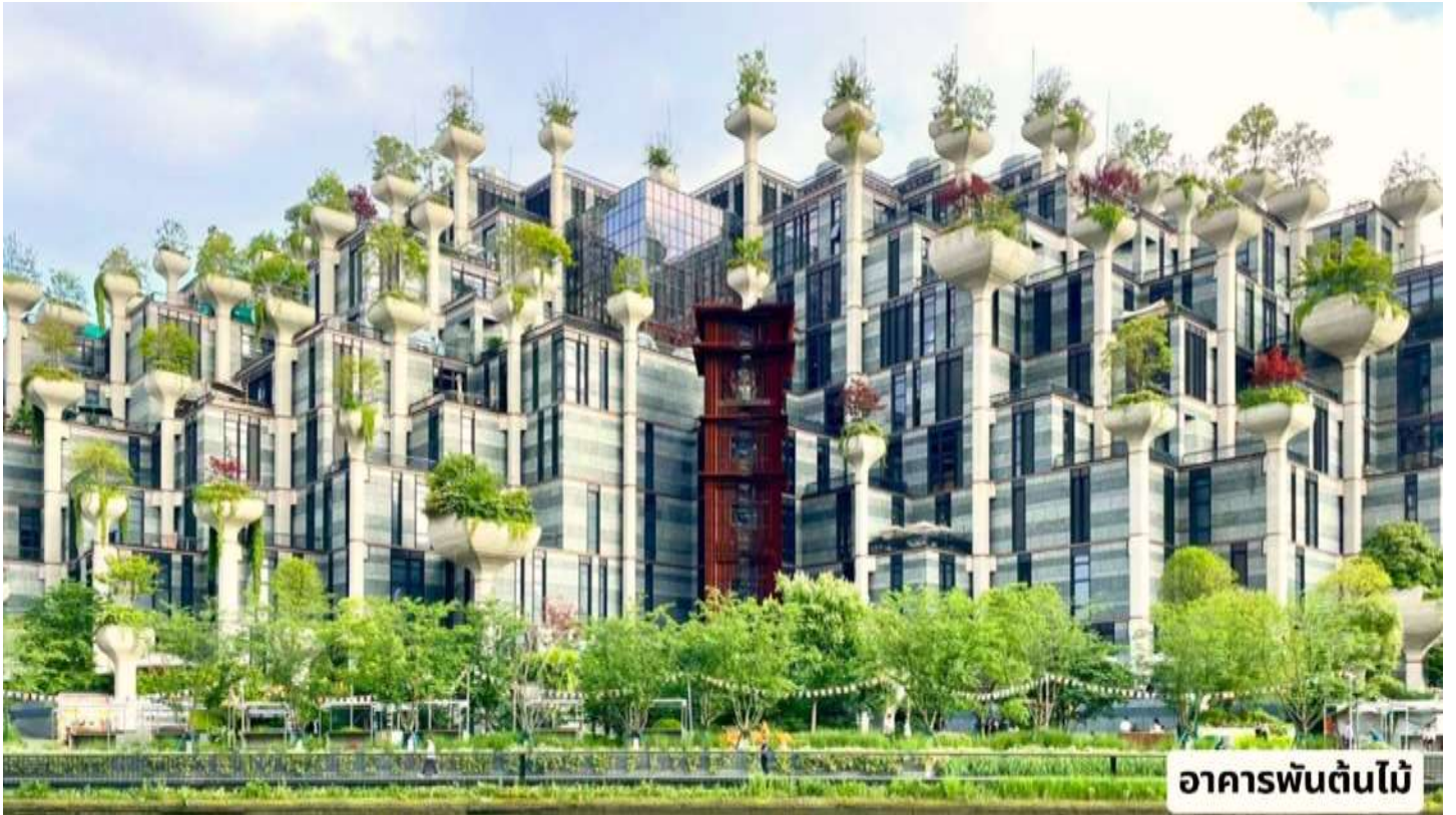
อาคารพันต้นไม้