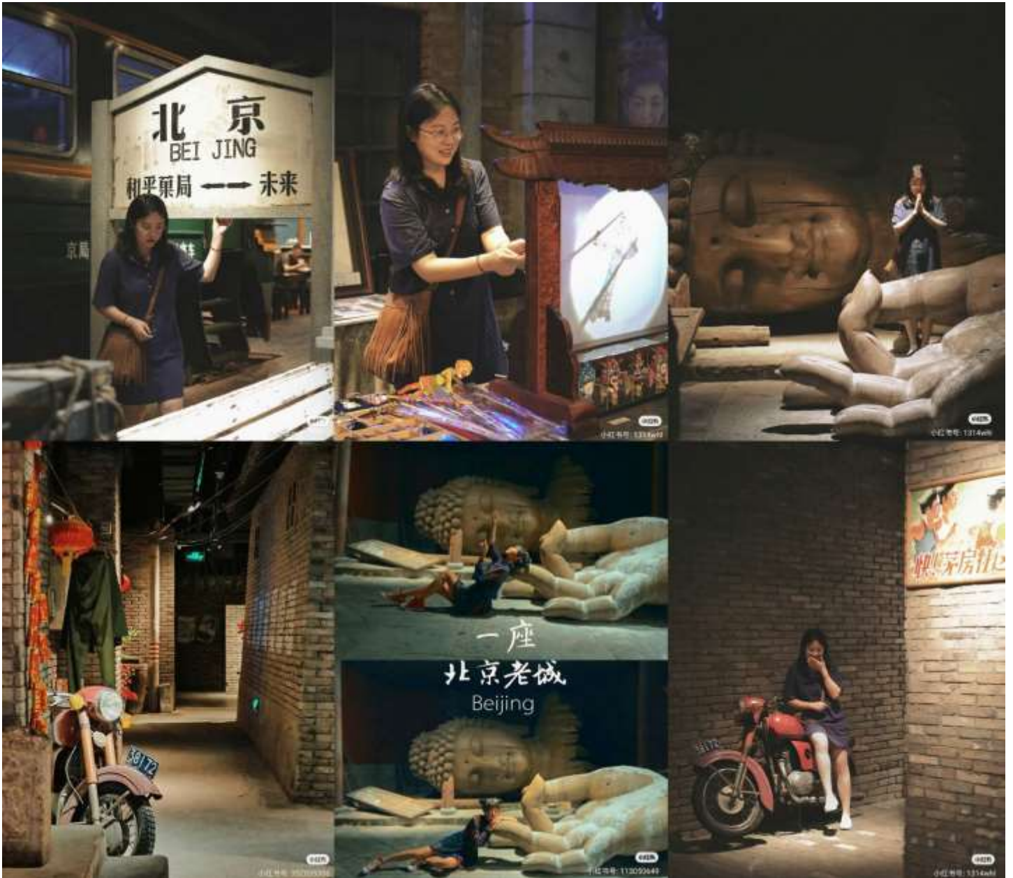
ขอบคุณเจ้าของภาพ (เครดิตตามภาพ)