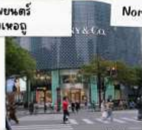
ถนนคนเดินหวยไห่