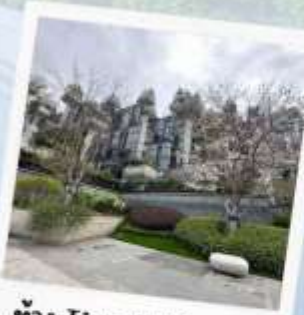
ห้าง Tian AN 1,000