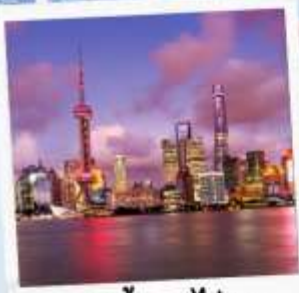
ชมวิวยามค่ำคืน