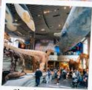
Shanghai Natural history Museum