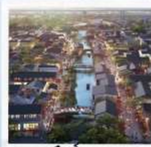
เมืองโบราณ ผานหลงกู่เจิน