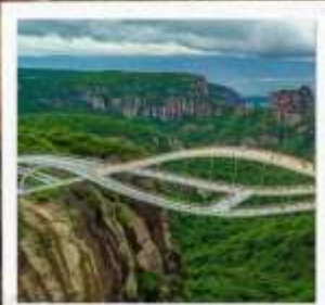
สะพานหฺรู้อี้