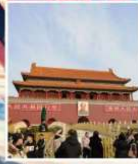
จัตุรัส เทียนอันเหมิน