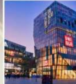
ย่านซานหลี่ถุน