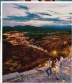
กำแพงเมืองจีน ซือหม่าโต่