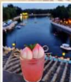
TANG FANG CAFE