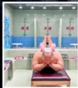
คาเฟ่ย้อนยุคเหอผิง