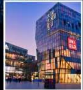
ย่านซานหลี่ถุน