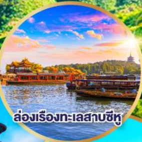
ล่องเรือทะเลสาบซีหู