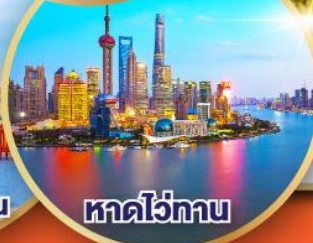
หาดไว่ทาน