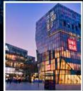
ย่านซานหลี่ถุน