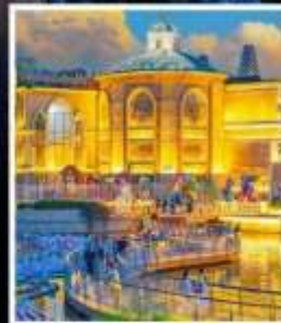
ห้าง SOLANA CENTER