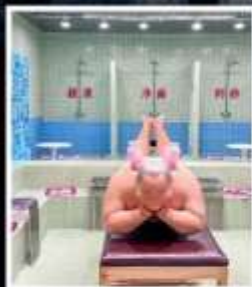
คาเฟ่ย้อนยุคเหอผิง