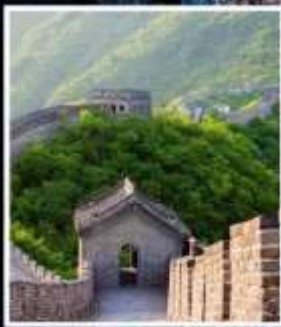
กำแพงเมืองจีน มู่เทียนยวี