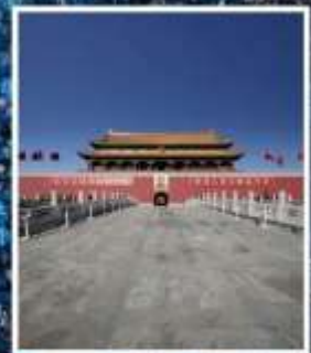
จัตุรัส เทียนอันเหมิน