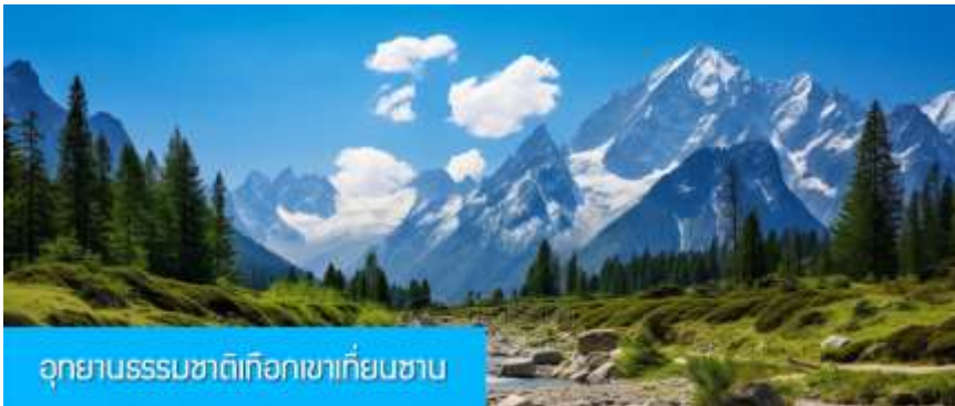
อุทยานธรรมชาติเทือกเขาเทียนชาน

พักที่ HAMPTON BY HILTON URUMQI HOTEL โรงแรมระดับ 4 ดาวหรือเทียบเท่าในเมืองอูรูมฉี