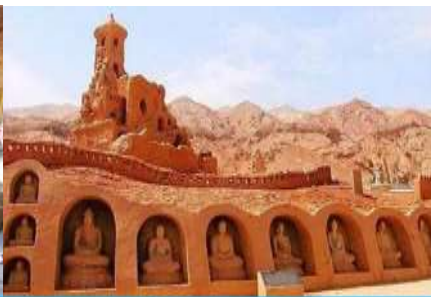
กำแพงมึนอวค์