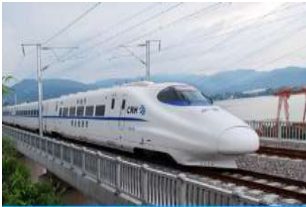
เบียร์รถไฟความเร็วสูง

พักที่ HOLIDAY INN EXPRESS HOTEL โรงแรมระดับ 4 ดาวท้องถิ่น หรือเทียบเท่าใกล้สนามบินหลันโจว