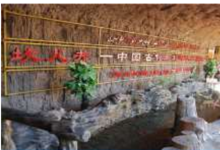
ระบบชลประทานอู๋หลู่ฟาน

พักที่ HAMPTON BY HILTON HOTEL โรงแรมระดับ 4 ดาวหรือเทียบเท่าในเมืองอู๋หลู่ฟาน