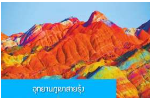
อุทยานภูเขาสายรุ้ง