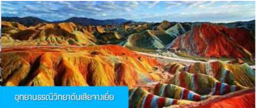
อุทยานธรณีวิทยาตันเสี่ยวเว่ย

วันที่สอง เมืองหลันโจว – นิทรรศน์ไฟความเร็วสูงสู่เมืองจางเยี่ย – เที่ยวชมอุทยานธรณีวิทยาตันเสี่ยวเว่ย (ภูเขาสายรุ้ง)