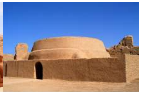
เมืองโบราณกาซางู๋เจี๋ย