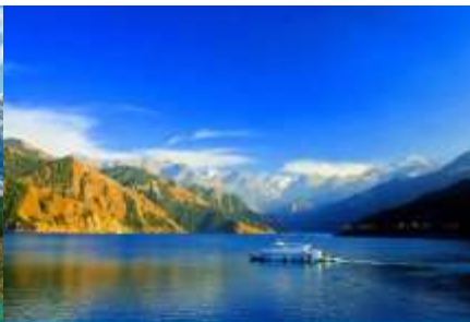
ล่องเรือทะเลสาบเทียนฉือ