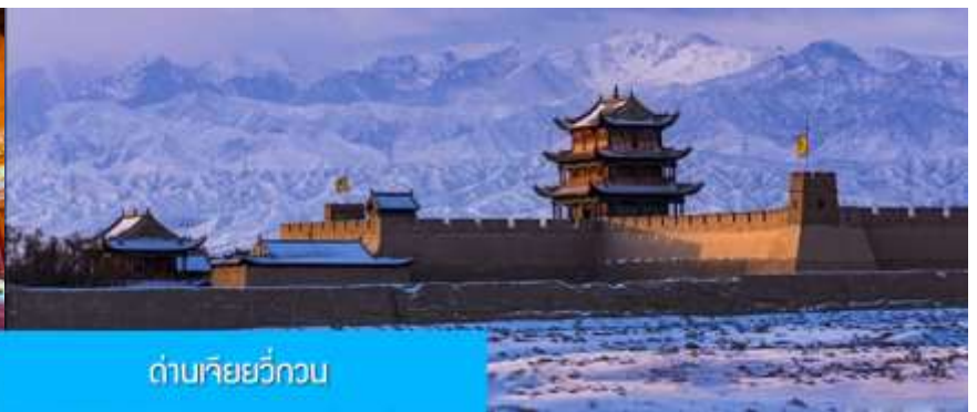
ด่านเจียยวี่กวน

วันที่สาม เมืองจางเยี่ยน – วัดพระใหญ่เมืองจางเยี่ยน –เดินทางสู่เมืองเจียยวี่กวน-ด่านเจียยวี่กวน