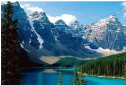
ภูเขาเทียนชาน

พักที่ MERCURE HOTEL โรงแรมระดับ 4 ดาวท้องถิ่นหรือเทียบเท่าในเมืองอูรูมูฉี