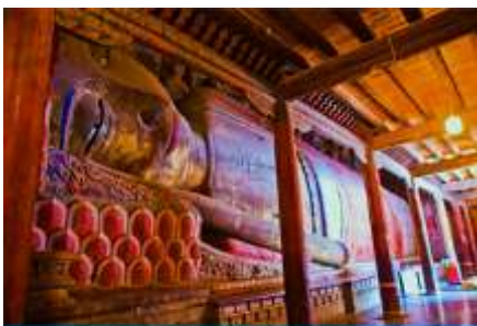
วัดพระใหญ่

พักที่ SI LU QIAN XI HOTEL โรงแรมระดับ 4 ดาวท้องถิ่น หรือเทียบเท่าในเมืองจางเยี่ยน