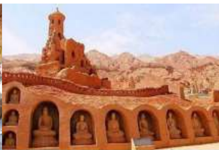
กำแพงเมือง