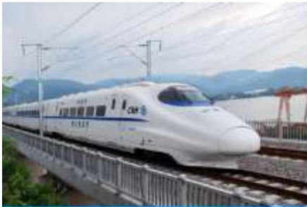
นิทรรศน์ไฟความเร็วสูง

พักที่ MADISON WEST STATION HOTEL โรงแรมระดับ 4 ดาวท้องถิ่น หรือเทียบเท่าในเมืองหลันโจว