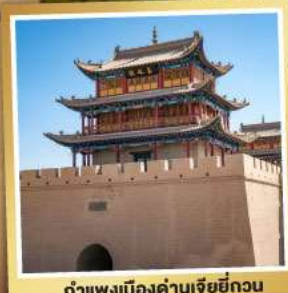
กำแพงเมืองด่านเจียหยี่กวน