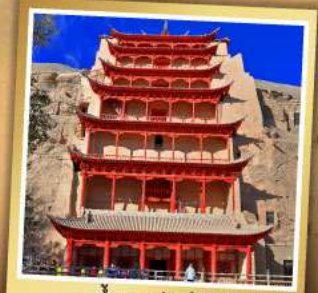
ต้าเกะสลักม่อเกา