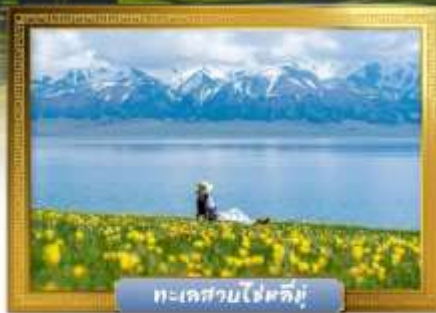
ทะเลสาบไซหลิมู่