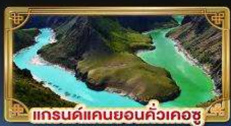
แกรนด์แคนยอนคั่วเคอซู