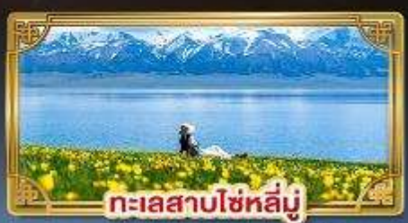
ทะเลสาบไซหลี่มู่

ชมวิวทุ่งหญ้าลอยฟ้า "นาราตี" สวยงามดุจเทพนิยาย