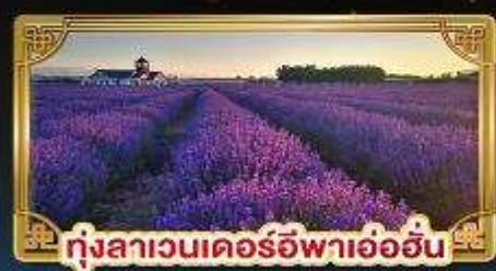
ทุ่งสาเวนเดอร์อีฟาเอ้อฮัน