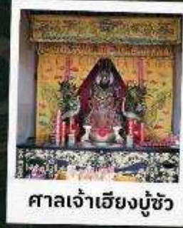
ศาลเจ้าเฮียงมู่ซิว