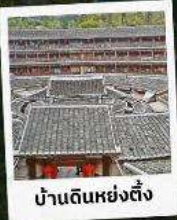
บ้านดินหย่งตั้ง