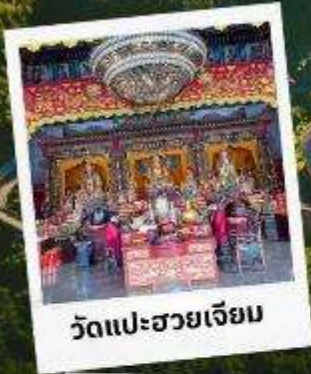
วัดแปะฮวยเจียม