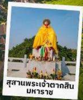
สุสานพระเจ้าตากสิน มหาราช