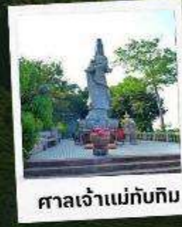
ศาลเจ้าแม่ทับทิม