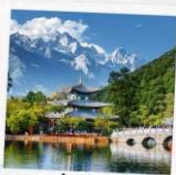
สระน้ำมังกรดำ