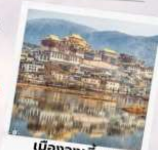
เมืองจางเตี้ยน เซียงกรีล่า