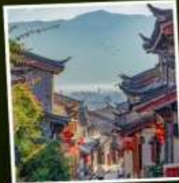
เมืองโบราณลี้เจียง