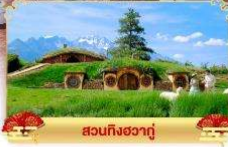
สวนกิ่งฮวาถู่

• ชมความยิ่งใหญ่ของภูเขาหิมะอันศักดิ์สิทธิ์ จุดชมวิวกาษาหิมะเหมยลี่