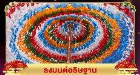
รงมนต์อธิษฐาน