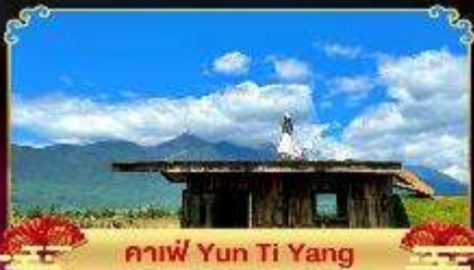
กาแฟ Yun Ti Yang