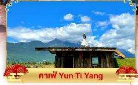
กาแฟ Yun Ti Yang