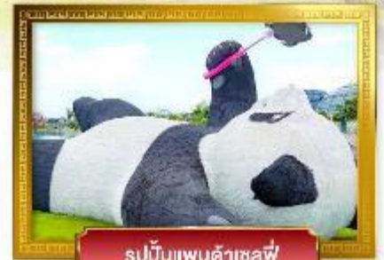
รูปปั้นแพนด้าเซลฟี