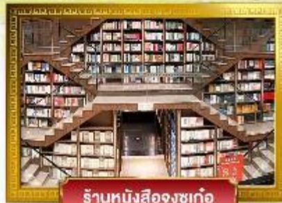
ร้านหนังสือจุงกู่