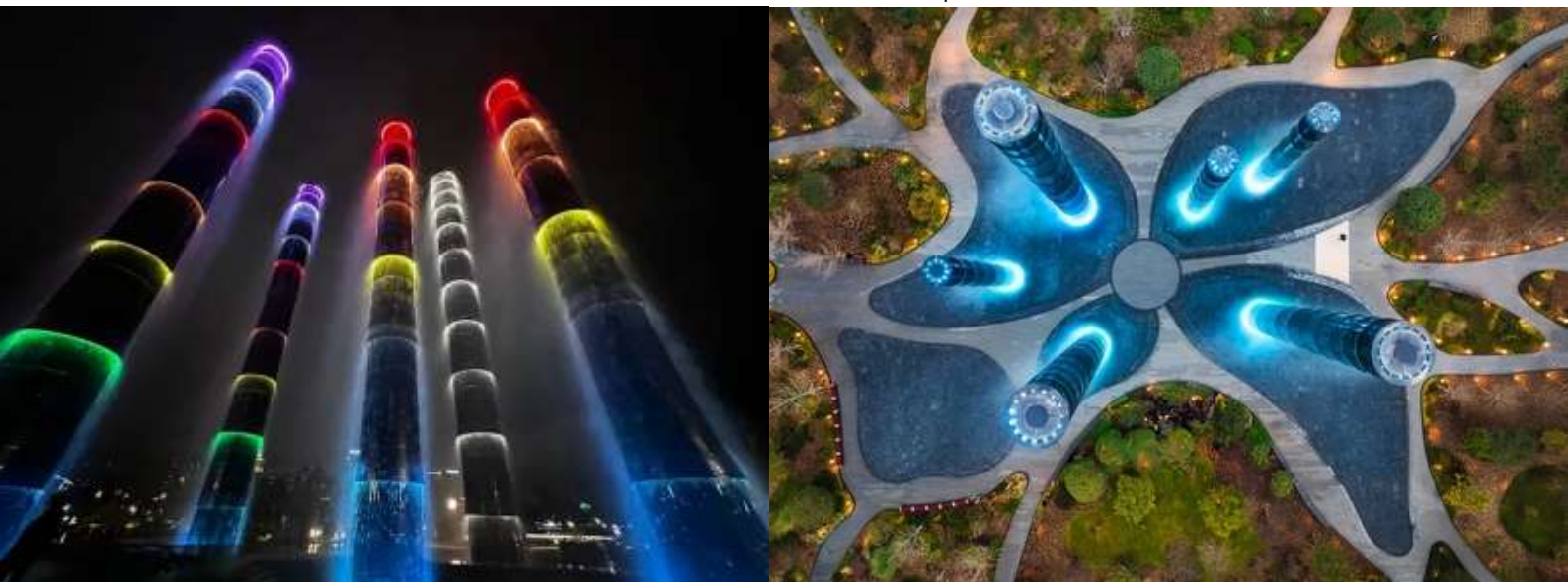
ได้เวลาอันสมควรเดินทางไปยัง ท่าอากาศยานเจิ้งตูเทียนฟู่ ประเทศจีน

เมตร ที่มีไฟสีรูปวงแหวน โดยจะมีน้ำในเสาไหลจากบนลงล่าง และจะมีแสงที่แสดงบนเสา 4 แบบด้วยกัน ได้แก่ การไล่ระดับสี กะพริบ วงกลม และแสงสีเดียวกัน จะเปลี่ยนวนไปทุกๆ 15 นาที