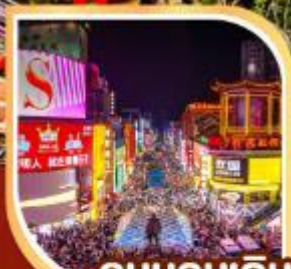
ถนนคนเดิน หวงซิงหลู่